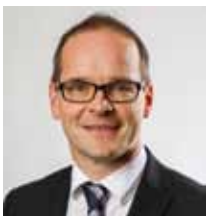
Грант Хендрик Тонне Министър на образованието на Долна Саксония

На тази основа ще можете да вземете информирано решение относно по-нататъшното образование на детето си. Щастливото дете, което е мотивирано да отговори на изискванията на избрания вид училище, трябва да бъде общата ни цел.