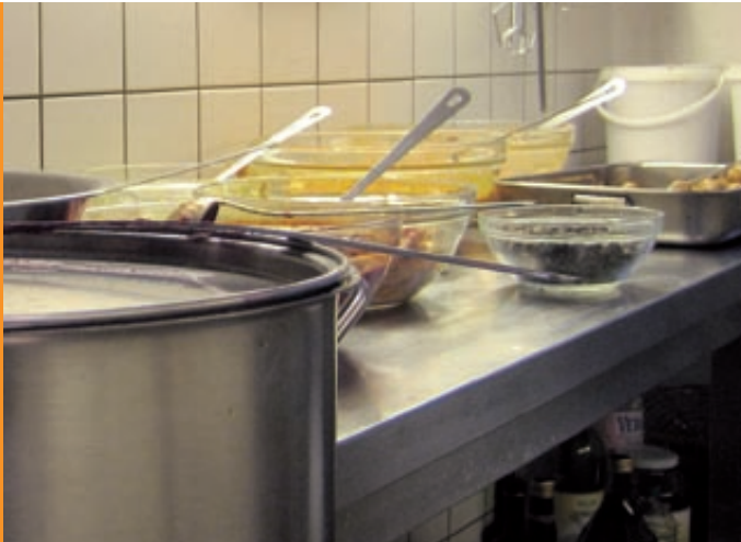
Sauberkeit ist Trumpf