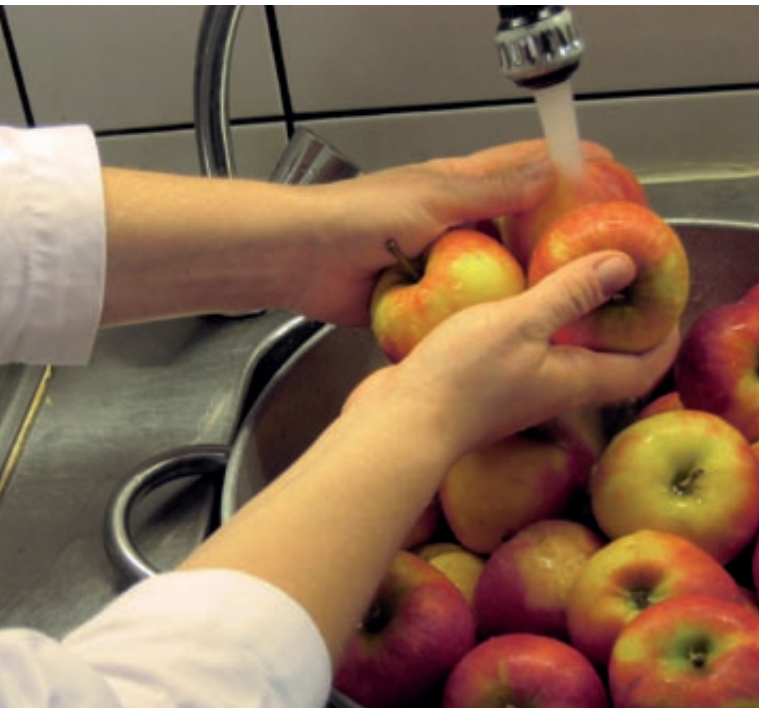
Extra Spülbecken für Lebensmittel