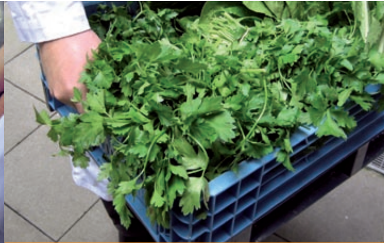
Richtig mit Lebensmitteln umgehen