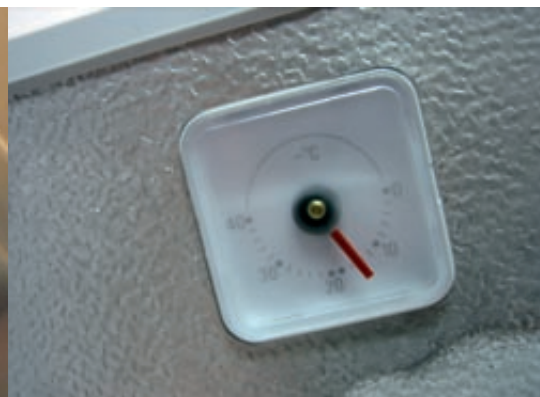
Messen bringt Sicherheit