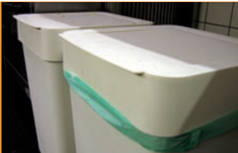
Auf die eigene Hygiene achten

In einer Küche fallen meistens „anorganische“ (z. B. Verpackungen) und „organische“ (z. B. Speisereste) Abfälle an. Wenn Sie organische Abfälle getrennt sammeln und nicht unmittelbar endgültig entsorgen, sollten sie möglichst gekühlt aufbewahrt werden, keinesfalls jedoch gemeinsam mit kühlpflichtigen Lebensmitteln. Wenn Sie über eine Verfütterung der Speisereste an Tiere nachdenken, setzen Sie sich unbedingt vorher mit dem Veterinäramt in Verbindung, um die einschlägigen Rechtsvorschriften zu erfragen.