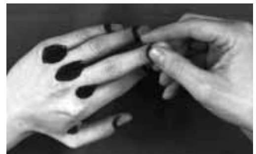
Bild 4: Beim Hautschutz auch die Haut um die Nägel nicht vergessen.