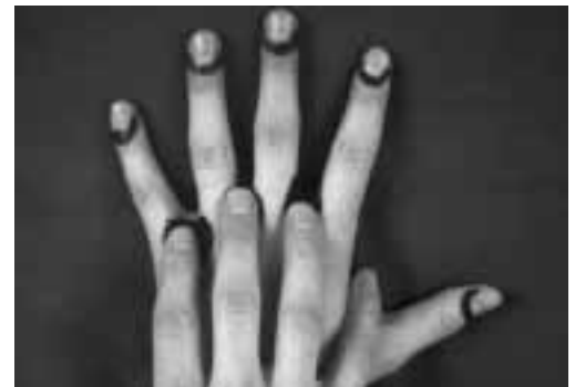
Bild 3: Creme für Hautschutz und Hautpflege gehört auch in die Fingerzwischenräume.