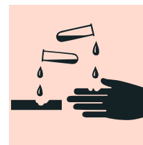
Bild 2: Das Gefahrensymbol «ätzend» weist auf ein grosses Risiko einer Hautschädigung hin. Hautschutzmassnahmen, insbesondere das Tragen geeigneter Handschuhe, sind zwingend notwendig.