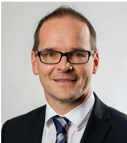
Grant Hendrik Tonne Kultus-Minister von Nieder-Sachsen